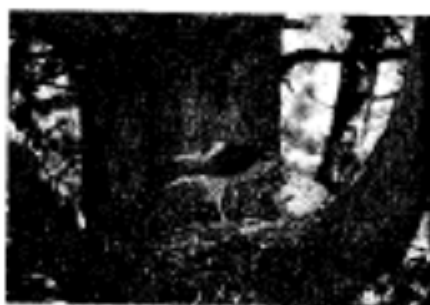
L'épervier d'Europe au nid. -TP-

chemin qui conduit au centre d'accueil de La Pouzaque puis, par des pistes forestières, au camp de La Plano (1 h aller-retour, 3,5 km). Rester jusqu'au point 6. Continuer tout droit, ravaler un pré et descendre légèrement à gauche le long d'un muret avant d'atteindre une châtaigneraie. Un peu plus bas, descendre à gauche dans un ruisseau sous un parc à sangliers. 7 Se diriger vers La Toupinatié à droite, passer devant la maison forestière de Massaguel, puis tourner à gauche pour entrer dans le bourg et revenir au départ.