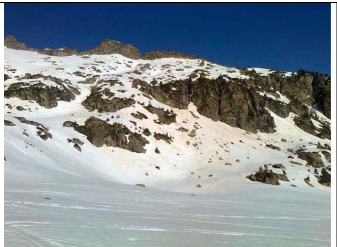
Ramougn et crête de Barris depuis le barrage d'Aubert

Après une excellente et confortable nuit dans l'annexe, nous partons un peu avant 8h00 par le chemin des laquettes. La aussi, portage sur plus de 200 m. Nous chaussons à l'entrée des laquettes que nous contournerons en rive droite, surplombons rapidement le barrage du lac d'Aubert et montons plein ouest vers la montagne des laquettes pour rapidement bifurquer nord ouest afin de traverser la brèche de Barris (2439 m) suffisamment enneigée pour ne pas déchausser et traverser en toute tranquillité, certes avec les couteaux. La montée vers le pas du Gat semblait alléchante mais ce sera pour une autre fois (👉).