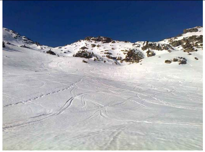
Vers le pas du Gat

Nous parvenons alors à un secteur de neige molle, nous pouvons enlever les couteaux. Grande traversée, petit couloir, et nous sommes au bas de la brèche de Chausenque vers 2700 m. Pas possible de manquer le vallon terminal en sud ouest, les derniers lacets se montent sans cale pour maintenir la meilleure accroche possible sur une neige qui durcit à l'approche de la crête sommitale (3020 m). Déchaussage et A/R au sommet à pied (3091 m, 12h45 →). Pas mal de monde en ce dimanche avec notamment deux grands groupes qui sont venus depuis le refuge de la Glère. Pas assez de place pour tout le monde, nous redescendons à 2800 m pour nous poser quelques minutes sur un rocher plat au milieu du vallon. Neige excellente sur toute la descente, nous parvenons un peu plus bas que les laquettes. Petite traversée du ruisseau et nous reprenons la route sur laquelle nous réussissons à glisser quelques centaines de mètres en sus jusqu'à 2000 m.