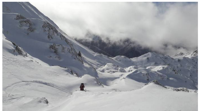
Visite post vol !